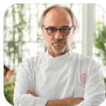
MARCO SACCO "PICCOLO LAGO"