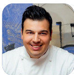
ARCANGELO TINARI "VILLA MAIELLA"