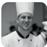
LUCA API "PASTICCERIA SILVANA"