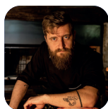
LORENZO ANIELLO "I DUE CIPPI"