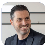
SIMONE MARCONI "ATTICO SUL MARE"