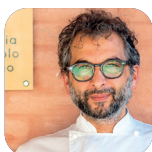
TIZIANO ROSSETTI "ANGOLO DIVINO"